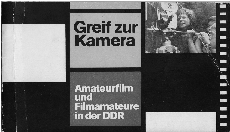
Abb. 1 Titelseite der Broschüre Greif zur Kamera ... von Jürgen Bonk und Karl-Heinz Ruhberg aus dem Jahr 1970.

Filme mussten entsprechende Themen verhandeln, die ostdeutsche Realitäten in weit stärkerem Maße aufnahmen als der Privatfilm. DDR-Amateurfilme wären dann als erstrangige Quellen der Alltagskultur eines nicht mehr existenten Landes anzusehen, die zudem noch durch den kulturpolitischen Rahmen, die Bedingungen vor Ort und die Biografien von Filmemachern gebrochen werden. Amateurfilm also ein Brennglas der damaligen Ordnung?