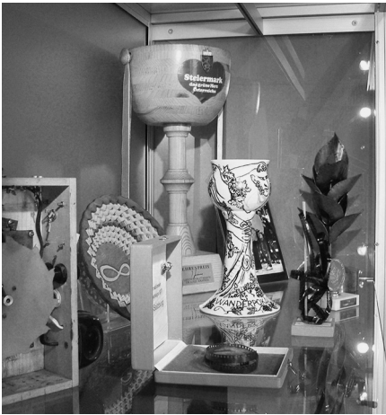
Abb. 2 Ausstellung »Amateurfilm in Brandenburg. Arbeit an der Wirklichkeit« im Filmmuseum Potsdam, Preise u. a. von Andreas Dresen und vom AFZ Senftenberg.