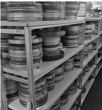
Abb. 3 Depotraum des Filmmuseums Potsdam, 16-mm-Amateurfilme vom Studio des WBK Berlin.