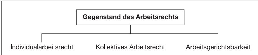
Abb. 1: Gegenstand des Arbeitsrechts