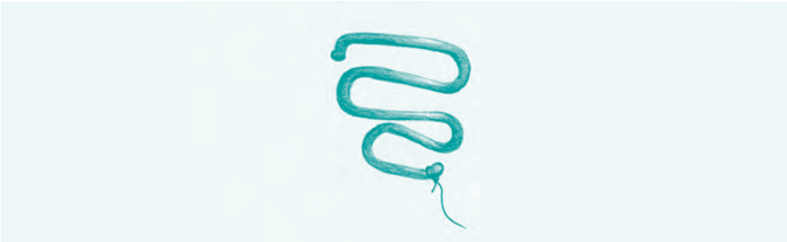
Abb. 10: Lippes-Loop: 4,5 x 4 cm. Zuletzt 1974 auf dem deutschen Markt erhältlich, das letzte der wirkstofffreien IUP, danach gab es nur noch Kupferspiralen und später die Hormonspiralen mit Levonorgestrel.