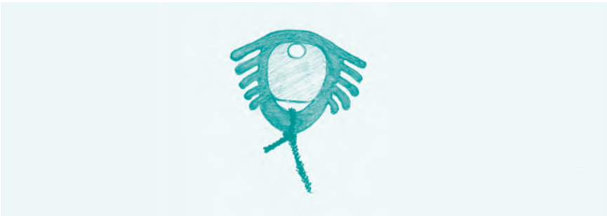
Abb. 11: Dalkon-Shield: 2,5 x 2,2 cm. Es war erstaunlich klein, für den Ärger, den es verursacht hat ...

Alle diese frühen Modelle der intrauterinen Verhütung hatten ein Problem: Ihre Wirkung beruhte auf ihrer Größe. Sie verhüteten umso sicherer, je mehr Kontakt sie zur Gebärmutterwand hatten und dort die Schleimhaut irritierten. Aber die großflächigen Druckstellen führten bei vielen Anwenderinnen auch zu starken Menstruationskrämpfen und hohem Blutverlust. Blutarmut und monatliche Krämpfe waren für viele Frauen der Preis für die sicherste Verhütungsmethode, die es bis zur Mitte der 1960er-Jahre gab.