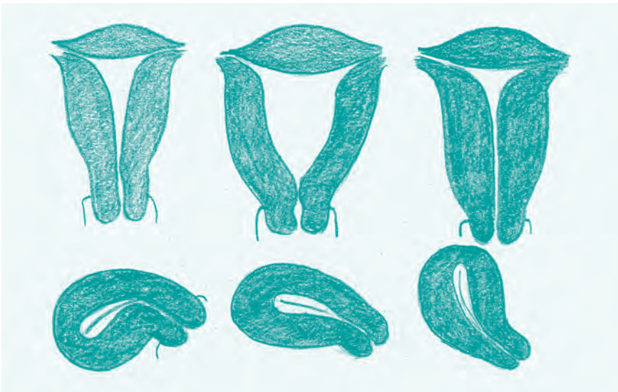
Abb. 12: Verschiedene Formen der Gebärmutter: Manche sind weit, andere eng und schmal, manche gebogen oder nach hinten abgeknickt. Die obere Reihe zeigt die Ansicht von vorne, die untere von der Seite. Seitlich gesehen entspricht die Gebärmutterhöhle eher einem Spalt.

In der Praxis, in der ich Ende der 1990er-Jahre meine Facharztausbildung beendete, wurden Multiload (ovales IUP mit Häkchen) in zwei Größen gelegt: die normalen für die Frauen, die schon geboren hatten, und die kleinen für Frauen ohne Kinder. Fertig! Und damit kamen vielleicht 80 Prozent der Frauen auch gut klar. Bei denen, die starke Blutungen hatten, auch nach sechs Monaten noch über Zwischenblutungen klagten oder unter Schmerzen litten, wurde die Spirale vorzeitig wieder entfernt. Da Schmerzen und Blutungsprobleme zu den bekannten Nebenwirkungen gehörten, die ein Teil der Frauen einfach hat-