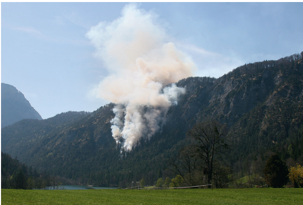
Bild 1: Momentaufnahme der Entstehung des Waldbrandes am Thumsee, Stadt Bad Reichenhall, Landkreis Berchtesgadener Land, am 13.04.2007. Dieser Entstehungsbrand entwickelte sich über einen Zeitraum von drei Tagen zu einer der größten Waldbrandkatastrophen im Freistaat Bayern.